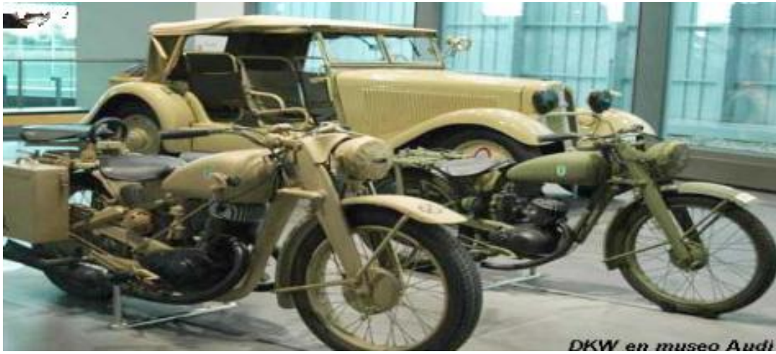
DKW en museo Audi